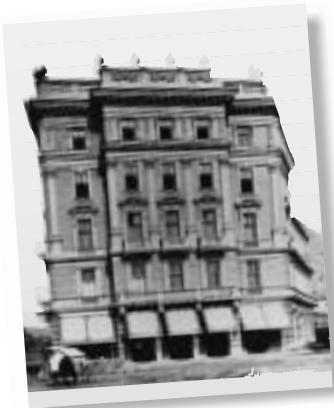
Das Haus um 1880 (mit Burgtheater-Baustelle davor)

DAS HAUS Oppolzgasse 6 ist im Jahr 1991 von der IG (Immobilien Gesellschaft) erworben und anschließend von Grund auf renoviert worden. Mit einem Besitz von fast 500 Millionen Euro (Wohnungen sowie Büros und Gewerbeflächen im In- und Ausland) zählt die IG zu den bedeutenden Immobilienunternehmen Österreichs. Neben einem umfassenden Service für ihre Büro- und Wohnungsmieter leistet die IG durch Investitionen in historisch bedeutsame Gebäude auch wichtige Aufgaben für die Allgemeinheit. Meilensteine in der Firmengeschichte stellen die Errichtung sowie der Betrieb der österreichischen EU-Botschaft in Brüssel dar. Ein Objekt, bei dem die IG nicht nur internationale Erfahrung sammeln, sondern sich auch aktiv für unser Land engagieren konnte. Gegründet wurde die IG im Jahr 1990. Sie ist ein hundertprozentiges Tochterunternehmen der Oesterreichischen Nationalbank. Im zweiten Weltkrieg