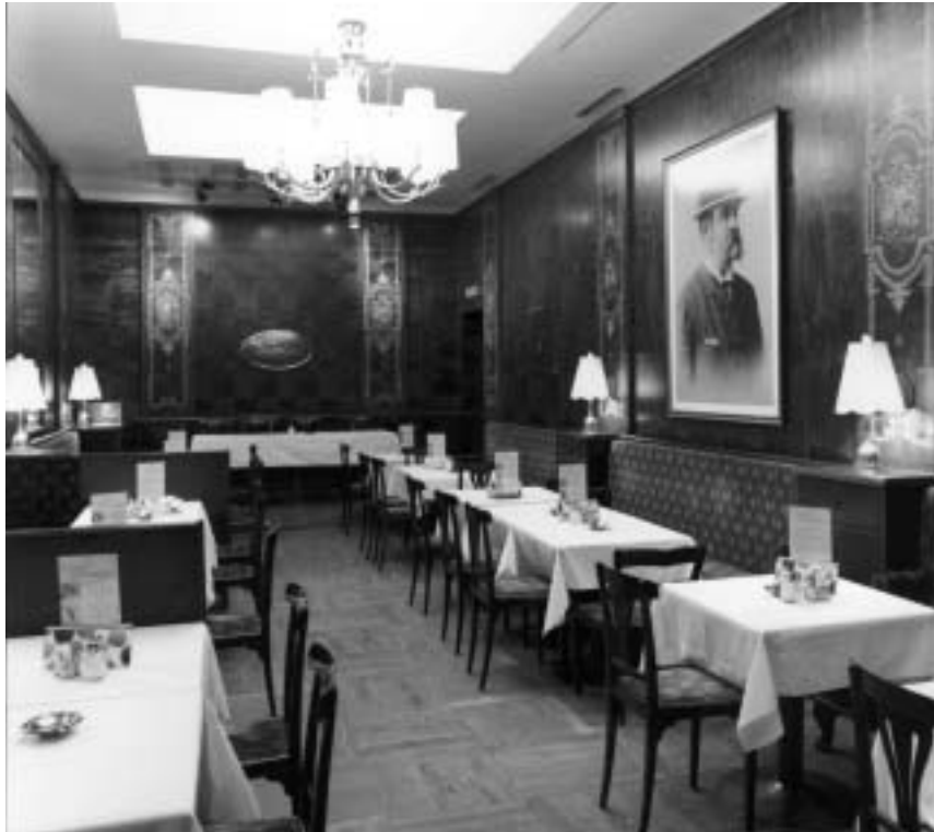
Der rundum erneuerte Landtmannsaal mit dem Portrait des Kaffeehaus-Gründers

AUFMERKSAME GÄSTE haben sicher bemerkt, daß im Sommer 2001 Teile des Kaffeehauses von Innenarchitekt Hans Hies renoviert und umgebaut wurden. Dies betraf den Pressekonferenzsaal einerseits sowie den gesamten Küchenbereich andererseits. Im Pressekonferenzsaal sind die Wand- und Deckenverkleidungen dem Stil der anderen Säle angepaßt worden, an der rechten Längsseite kann man jetzt ein überlebensgroßes Portrait des Kaffeehaus-Gründers bewundern (Deshalb heißt dieser Saal jetzt Landtmannsaal!).