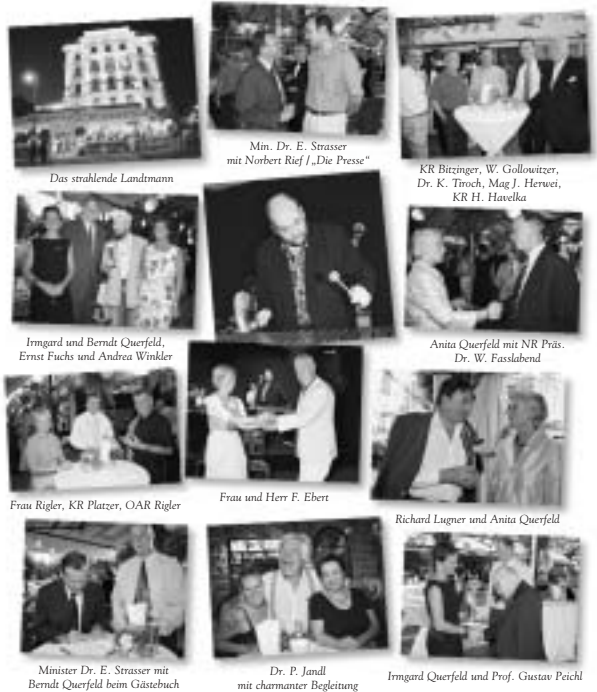
Das strahlende Landtmann