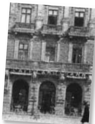
Ansicht um 1918