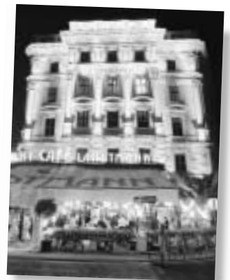
Mit Festbeleuchtung im Jahr 2002