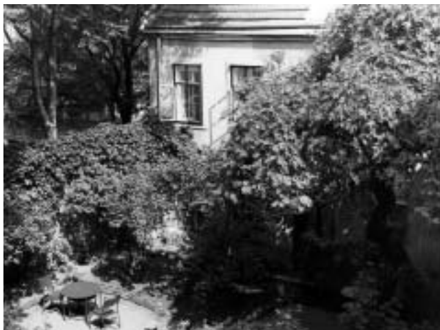
Blick in den Innenhof des Kerl'schen Stammhauses (Lindengasse 46)