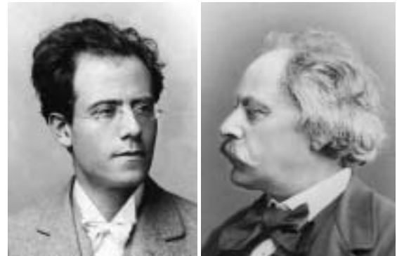
Gustav Mahler und Karl Goldmark