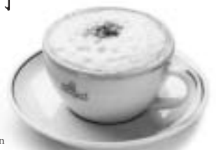
Eine köstliche Melange im Café Mozart, Albertinaplatz 2 (bei der Oper!)

* Quelle: Herta Singer. Im Wiener Kaffeehaus, Wien 1959