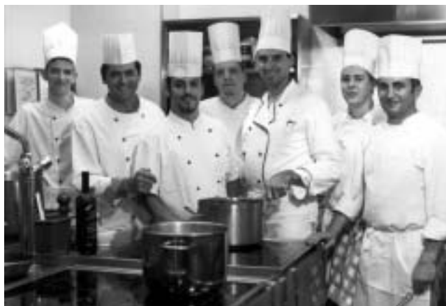
Das Team, das im Landtmann für exzellente, authentisch Österreichische und Wiener Küche sorgt (Wer übrigens gerne in diesem Team mitarbeiten möchte, meldet sich unter der Telefonnummer 01/24 100-01)

WORAUF MAN SICH als Landtmann-Gast in Zukunft freuen darf? Auf Schmankele wie Bärlauchtascherln, Löwenzahnsalat oder Kalbsrückenfilet auf Kräuterschaum im Frühjahr; auf Schafkäse Ravioli, köstliche Salate und Schwammerlspezialitäten im Sommer; auf Kürbisgerichte und Wild mit hausgemachter Vogelbeermarmelade im Herbst sowie auf Gansln, Enten und Schilchersuppe im Winter. All das sind Rezepte, bei denen einem schon während des Lesens das Wasser im Mund zusammenrinnt. In diesem Sinne: Guten Appetit!