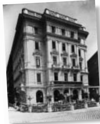
Das Haus in den 30er Jahren